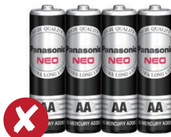
3 號 碳鋅 電池