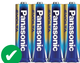
3 號 鹼性 電池